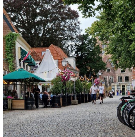
Rechter foto: Doorkijkje zuidzijde kerkplein vanuit oostelijke richting.