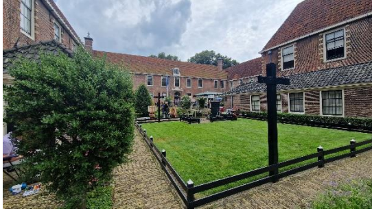
Linker foto: Binnentuin van het Sint-Pietershof.