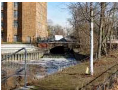
Uitmonding van de Nordpanke in de Nordhafen Vorbecken

Aan de overzijde van de Chausseestraße bevindt zich het ondergrondse punt waar de Nordpanke aftakt van de Südpanke.