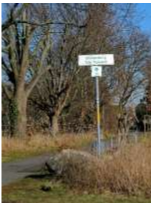
We verlaten Berlijn - Welkom in Brandenburg