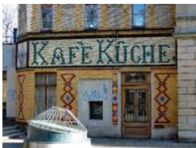
Bijgebouw links de Bibliothek am Luisenbad